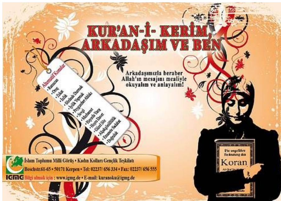
«Der Koran, mein Freund und Ich»: ein Projekt der IGMG-Frauenabteilung, das junge Muslime mit dem Koran vertraut machen soll

Als Beleg für eine gezielte Abgrenzung von der nicht-islamischen Umwelt wird von Kritikern der IGMG auch auf das Frauenbild hingewiesen, dass im Umfeld der IGMG vertreten wird. Beispielhaft dafür ist eine Fatwa, die sich ausdrücklich gegen die Teilnahme von Mädchen an Klassenfahrten ausspricht: «Eine