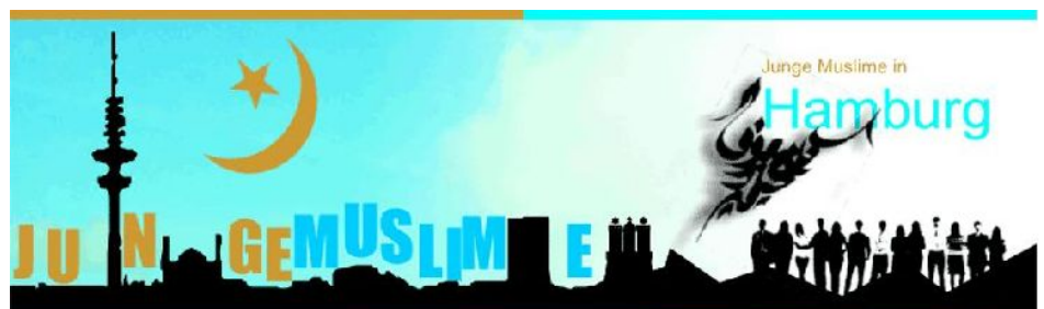
Website der IGMG-nahen Initiative "Junge Muslime in Hamburg"