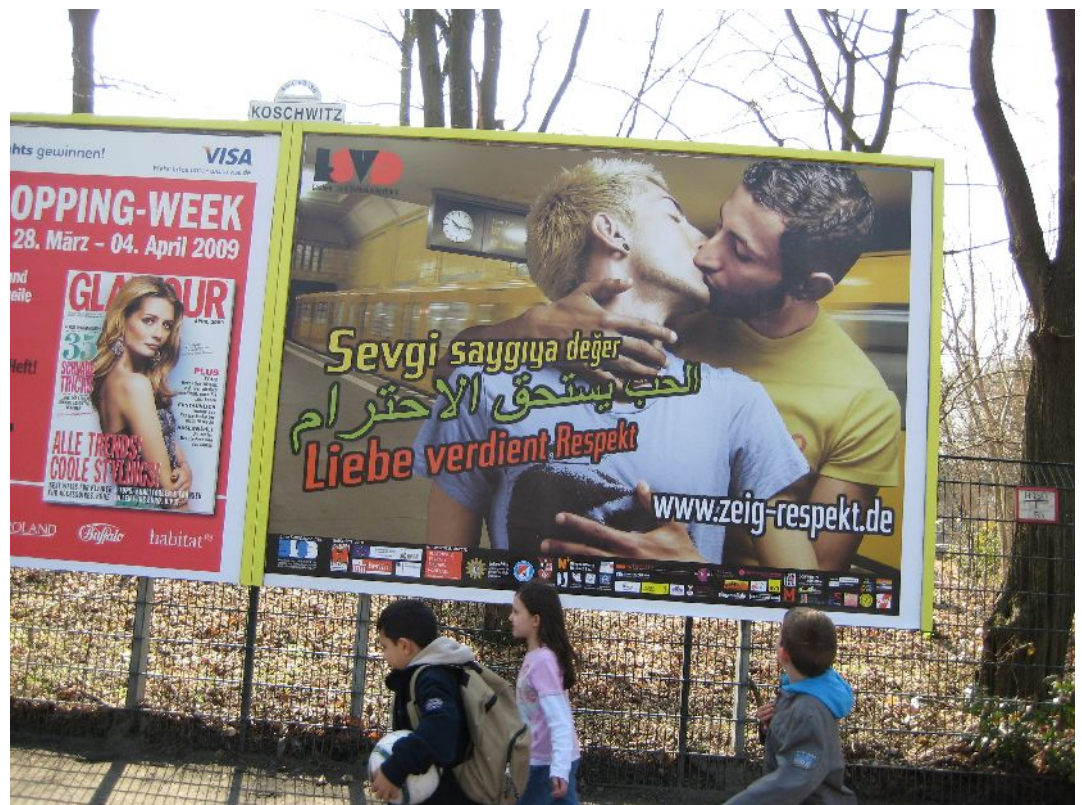
Türkiyemspor und der Verein Iranischer Flüchtlinge in Berlin zählen zu den Unterstützern einer Kampagne des Lesben- und Schwulenverbandes Berlin-Brandenburg (LSVD): «Liebe verdient Respekt»

Eine Pädagogik, die lesben- und schwulenfeindlichen Einstellungen und der daraus resultierenden verbalen und körperlichen Gewalt begegnen will, muss daher der Komplexität unserer Gesellschaft gerecht werden. Das Phänomen muss zunächst definiert sein: Was genau ist Homophobie, wie äußert sie sich in meinem Stadtteil? Dabei sind lesbische Migrantinnen und schwule Migranten in der Bildungsarbeit wichtig, weil sie «hüben wie drüben» die selbst- und fremdzugeschriebene Homogenität der jeweiligen Gruppen (heterosexuelle Migrant/innen versus weiße, deutsche,