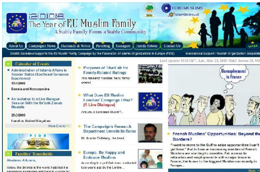
Website der FIOE-Kampagne zum «Jahr der muslimischen Familie in der Europäischen Union»

Ziel der Kampagne ist es, das Bewusstsein für die Bedeutung der islamischen Familie als Voraussetzung für die Integration der Muslime in Europa zu stärken.