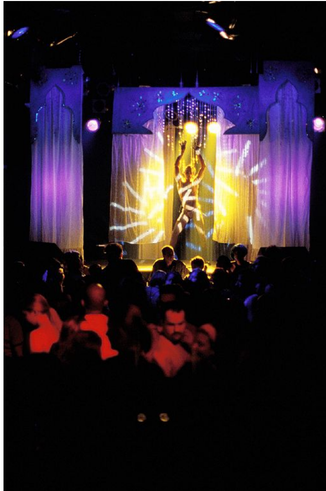
Auf der Gayhane-Party im Berliner SO36 feiern auch viele Lesben, Schwule und Transsexuelle mit türkischem oder arabischem Migrationshintergrund

Alters- und geschlechtsspezifische Ansätze zur Bearbeitung von Homophobie müssen sich daran orientieren, warum spezifische Äußerungen und Verhaltensweisen für ganz bestimmte Jugendliche attraktiv sind, denn weder alle herkunft-deutschen noch alle migrantischen Jugendlichen sind homophob.