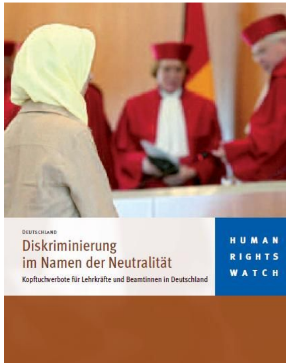
Bericht von Human Rights Watch über Diskriminierungen von Musliminnen mit Kopftuch in Deutschland

Muslimische Lehrerinnen, die aus religiösen Gründen ein Kopftuch tragen wollten, würden dennoch gezwungen, sich zwischen Beruf und Glauben entscheiden zu müssen, womit ihr Recht auf Religionsfreiheit eingeschränkt würde – so das Ergebnis der Studie von Human Rights Watch , die vor allem die erheblichen beruflichen Nachteile in den Blick nimmt, die religiöse Lehrerinnen