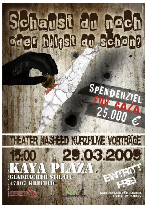
Veranstaltung der Islamischen Denkfabrik: «Hilfst du schon?»

In diesem Sinne erklärte der auch bei vielen deutschen Muslimen angesehene Scheich Yusuf Al-Qaradawi, dass es bei diesen Initiativen eben nicht nur um das Sammeln humanitärer Spenden gehe, sondern um das Erfüllen der religiösen Pflicht eines jeden Muslims. ■